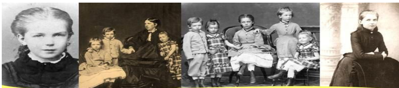
Julia Ledóchowska - z mamą i rodzeństwem